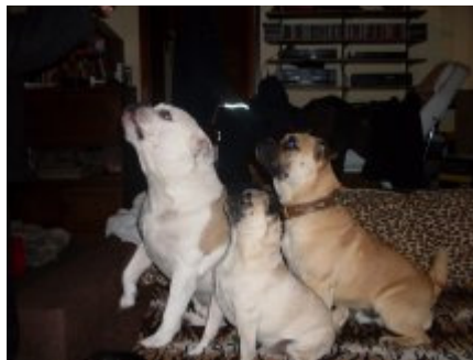
Für Leckerchen tun wir alles