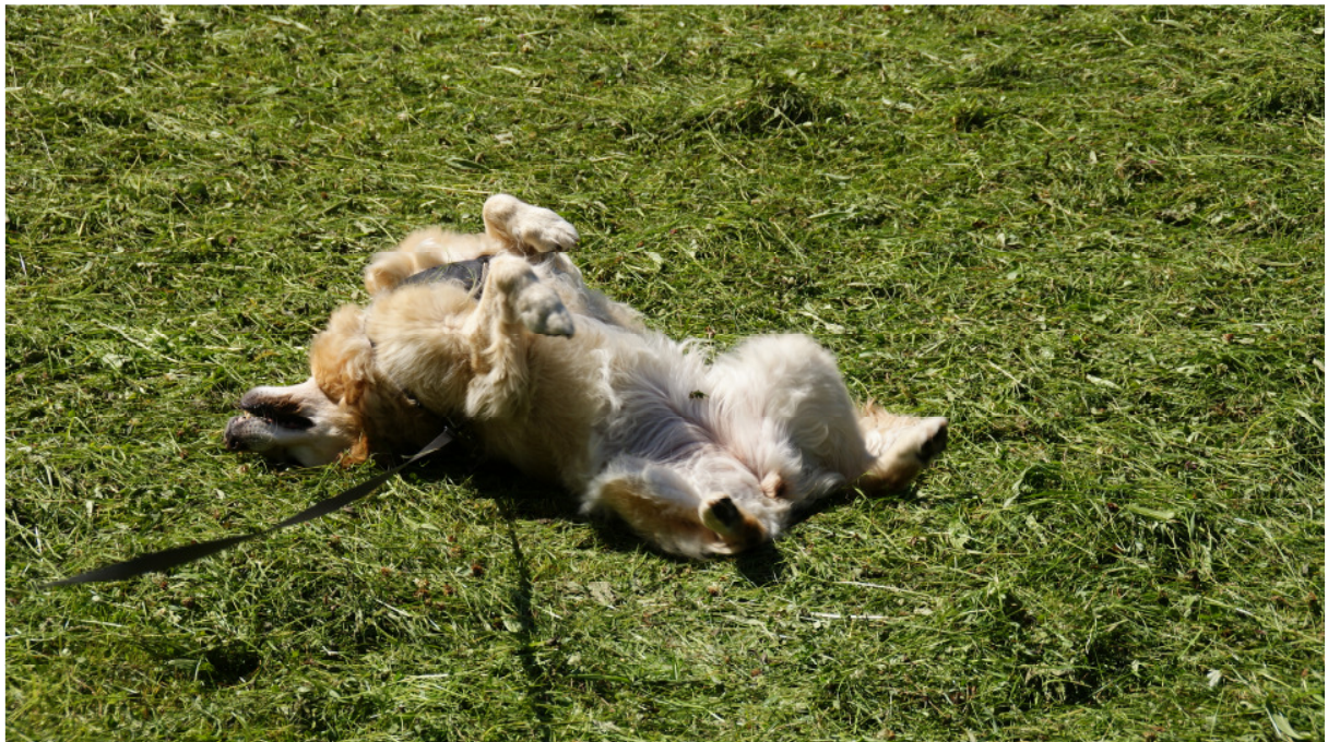
Lissy im Garten „also schlecht geht es mir nicht“