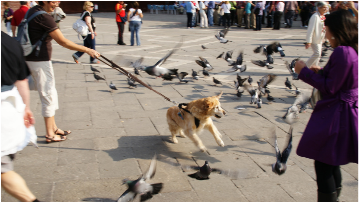
Lissy in Venedig „Tauben erschrecken macht Spaß“