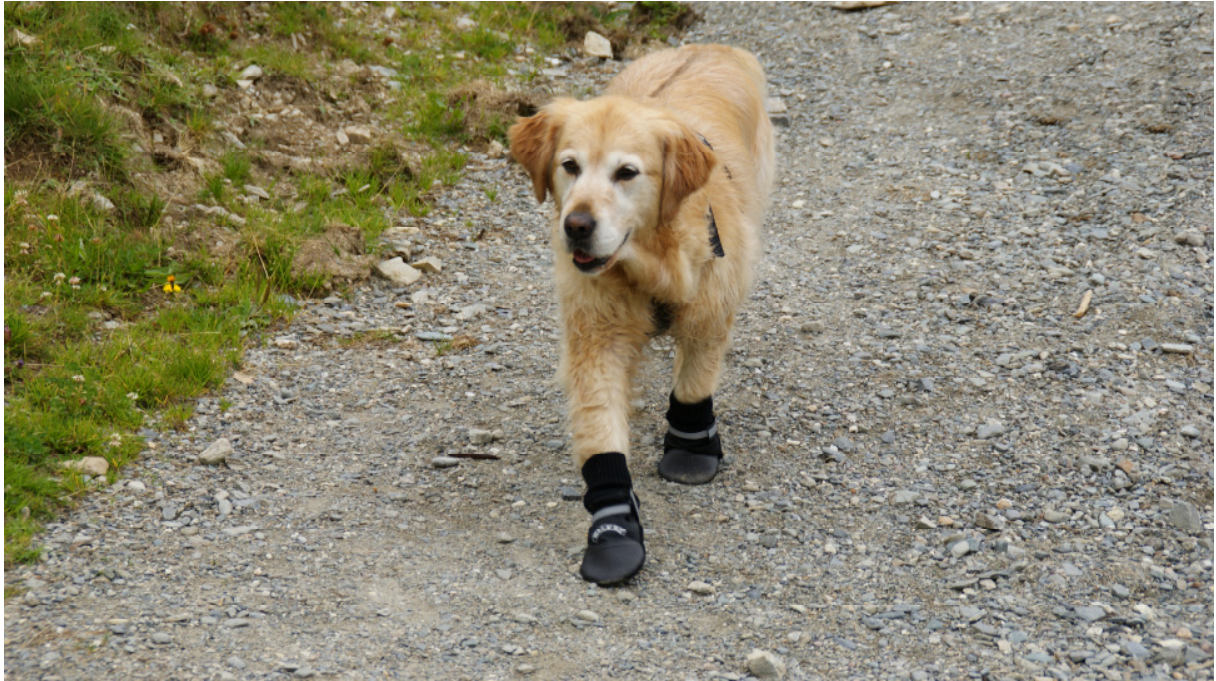
Lissy mit Bergschuhen „das mit den Pfoten war kein Spaß“