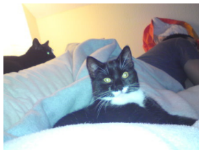
Hier schlafen wir bei Papa.

Jetzt noch ein paar kleine Bilder zum Beweis: